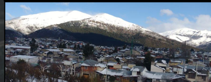
C° Carbón. Llanis Hanz, S. 2023