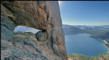
C° Ventana. Battaglia, V, 2021