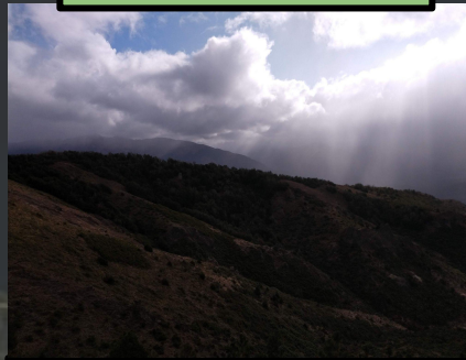
C° Otto. Gonzalez Lovato, L. 2020