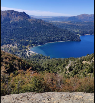
C° San Martín. Solis, C. 2022