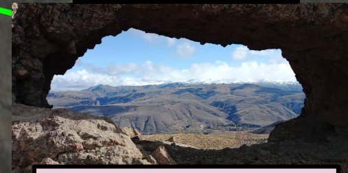
C° Puntudo. James, F. 2023