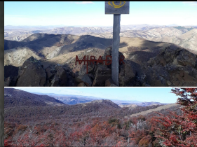
C° Chaluaco. Alder, I. 2023