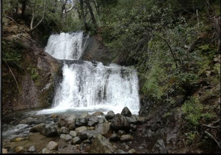
Cascada de los duendes. Gonzalez Lovato, L. 2019