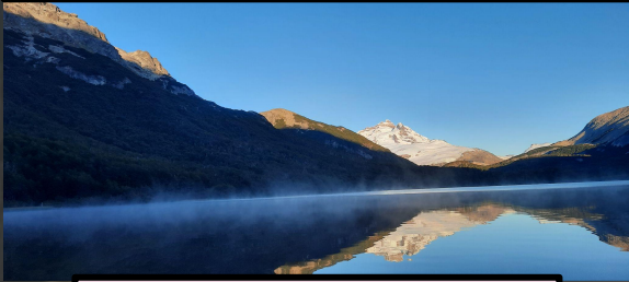
Laguna Ilón. Alder, I. 2022