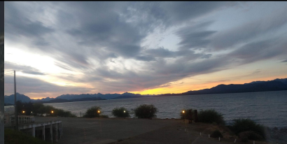
Lago Nahuel Huapi. Gonzalez Lovato, L. 2021