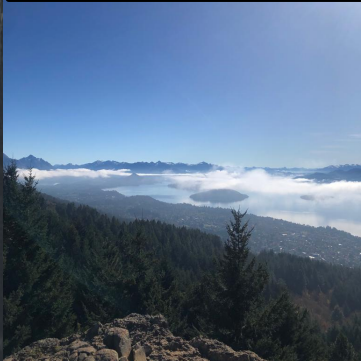
C° Otto. Gonzalez Lovato, L. 2023